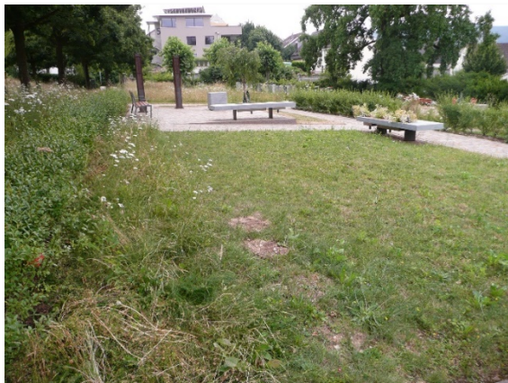
Gemeinschaftsgrab mit Urne