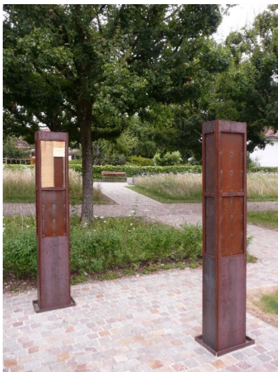
Beschriftung Gemeinschaftsgrab und Aschengruft

Im Gemeinschaftsgrab oder in der Aschengruft kann auf Wunsch der verstorbenen Person oder der Angehörigen auf ein Namensschild der Name, der Vorname sowie das Geburts-/Todesjahr eingraviert werden. Die entstehenden Kosten gehen zu Lasten der Angehörigen. Das Anbringen des Schildes übernimmt die Gemeinde.