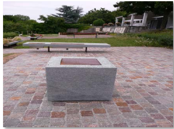
Aschengruft ohne Urne