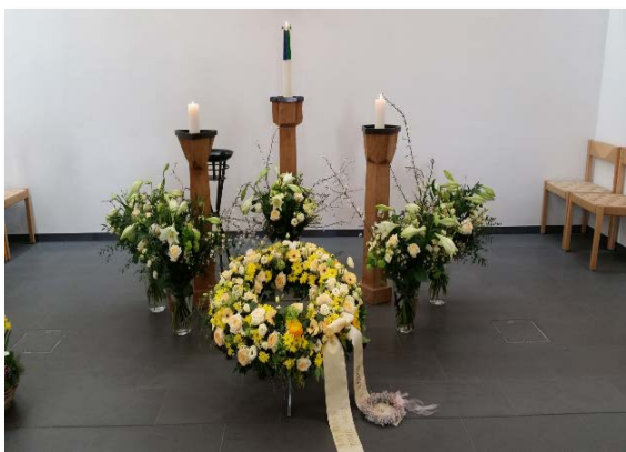
Mit Schmuck für Urnenabdankung