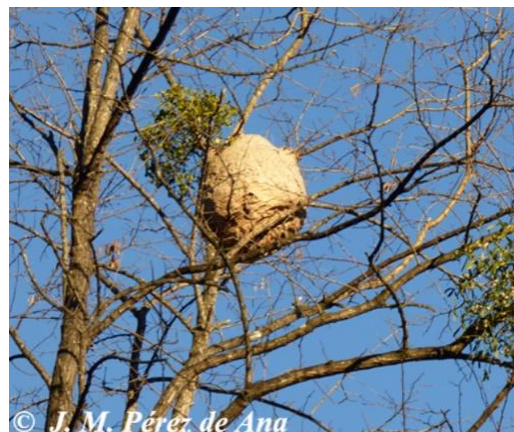
Sekundärnest im Baum