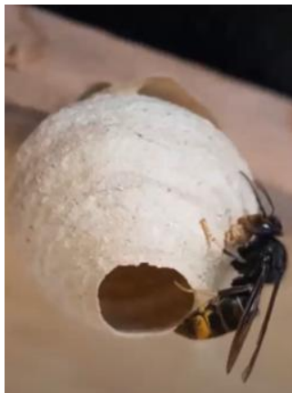
Primärnest (frühes Stadium)

Sekundärnester: Bis zu einem Meter Durchmesser, oft in Baumkronen (auch höher als 20m).